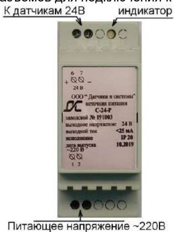
Рис. 1 – расположение разъемов ИП.

Расположение разъемов для подключения к ИП показано на рис. 1.